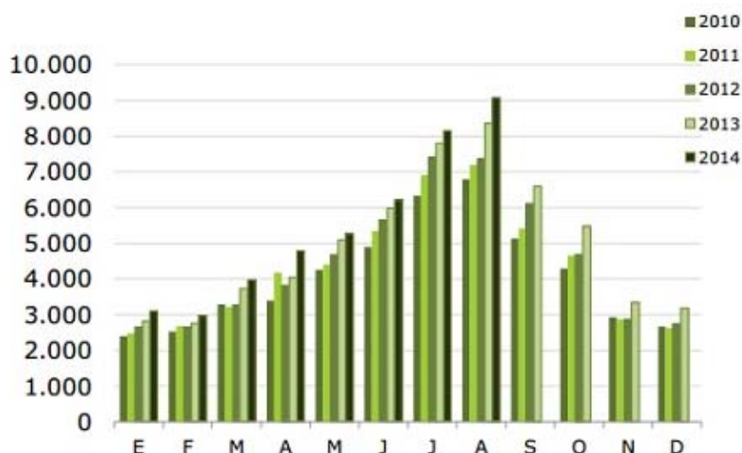
Gasto total de los turistas no residentes, según meses (millones de €)