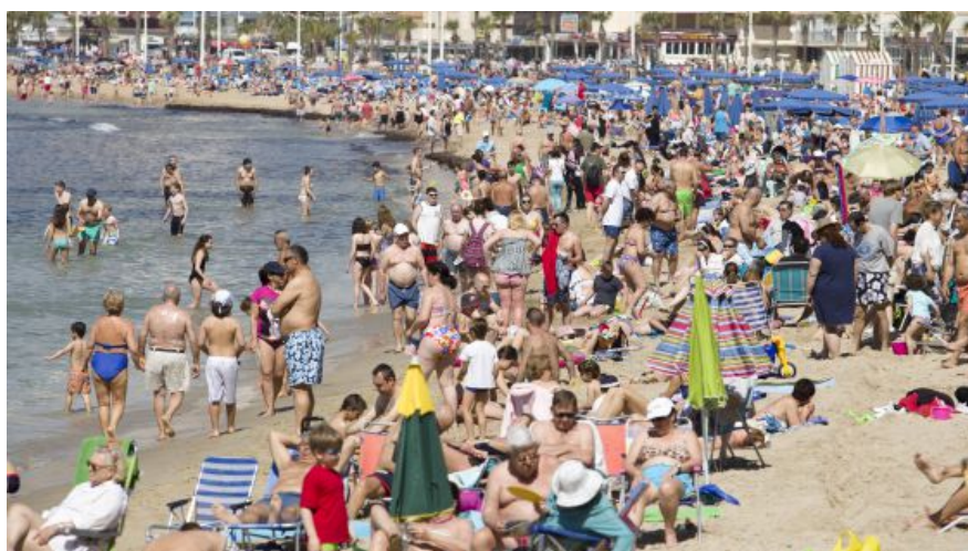
La playa de Levante de Benidorm (Alicante), abarrotada de gente.

España no ha encontrado aún un filón de empleo y crecimiento tan vigoroso como el de esa industria que siempre ha sido su gallina de los huevos de oro: el turismo . Y agosto ha marcado un hito para el sector al lograr la entrada de 9,1 millones de turistas extranjeros, lo que supone un incremento del 8,8% respecto al mismo mes del año pasado pero, sobre todo, implica el récord hasta ahora, según los datos la encuesta de Movimientos Turísticos en Fronteras (Frontur) , que hizo públicos el lunes el Ministerio de Industria, Energía y Turismo y que miden el número de visitantes que pernocta al menos una noche en España. El sol y playa es para la economía española el motor más incontestable de la recuperación, pese a que crea puestos de trabajo de gran temporalidad y que, para disgusto de los hoteleros, los visitantes echan cada vez más mano de los apartamentos de alquiler.