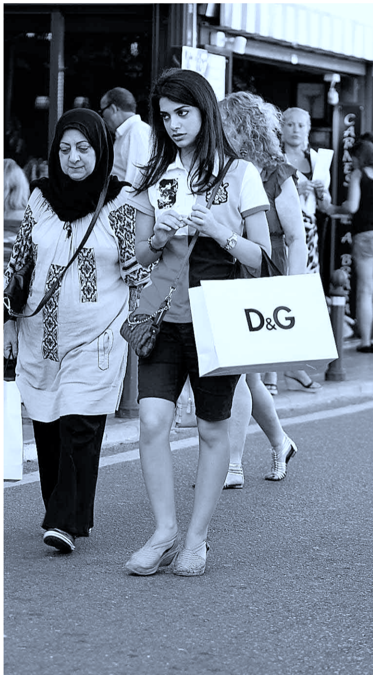
Dos turistas pasean por Puerto Banús, en Marbella.

El gasto medio de cada viajero internacional en Andalucía es de 1.032 euros, la cifra más alta de las zonas de sol y playa