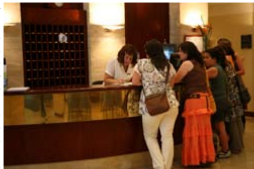
La crisis ha afectado al turismo, aunque hay signos de recuperación

El recorte del gasto en turismo es uno de los motivos por los que las familias españolas optan cada vez más por el turismo nacional, por paquetes de todo incluido u otros medios de transporte distintos al avión. A la vista de las estadísticas de transporte de pasajeros del aeropuerto de Zaragoza, en 2009 se anotó una disminución del 11% de pasajeros en comparación con el año anterior, mucho más notable en el caso de los pasajeros nacionales (17%) que internacionales (6,5%), lo cual también puede verse afectado por el incremento observado este tipo de transporte por la celebración de la Expo. En lo que va de año (hasta julio), el transporte de pasajeros ha aumentado ligeramente (2,3% respecto al mismo periodo del año anterior) gracias al turismo internacional.