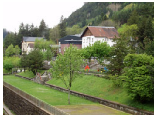
La ocupación de las plazas hoteleras ha aumentado

El Servicio de Estudios de Caja Inmaculada ha elaborado este estudio sobre el sector turístico en Aragón y España con motivo del Día Mundial del Turismo que se celebrará este lunes. Según la Organización Mundial del Turismo, este sector comprende las actividades realizadas por las personas durante sus viajes a lugares distintos a su residencia habitual, por un periodo de tiempo inferior a un año con fines de ocio, negocios o cualquier otra actividad.