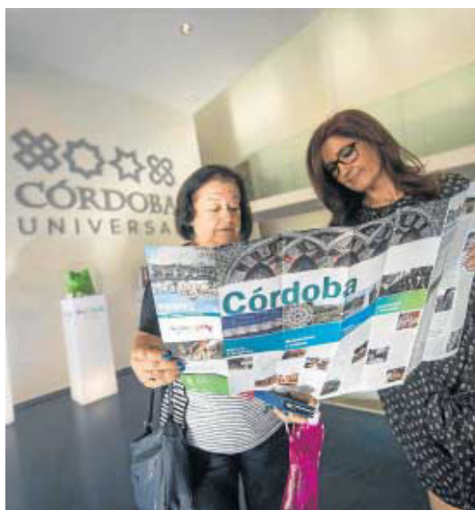
Dos turistas consultan un mapa en el Centro de Visitantes de Córdoba.

“habrá nubarrones” en este periodo, tampoco por motivos vinculados al virus del ébola, que, según ha subrayado, está desde el primer momento “muy aislado en un caso concreto” y no debe generar alarma desde el punto de vista turístico.