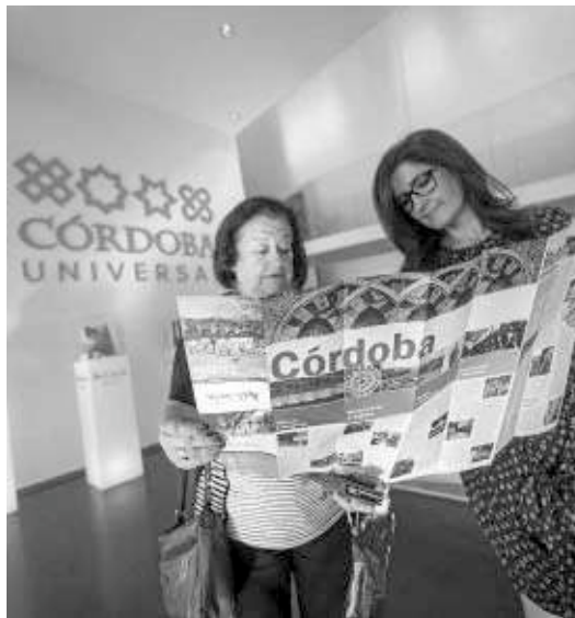
Dos turistas consultan un mapa en el Centro de Visitantes de Córdoba.

"habrá nubarrones" en este período, tampoco por motivos vinculados al virus del ébola, que, según ha subrayado, está desde el primer momento "muy aislado en un caso concreto" y no debe generar alarma desde el punto de vista turístico.