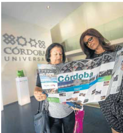
Dos turistas consultan un mapa en el Centro de Visitantes de Córdoba.