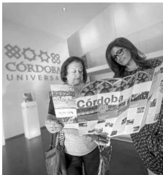
Dos turistas consultan un mapa en el Centro de Visitantes de Córdoba.

"habrá nubarrones" en este periodo, tampoco por motivos vinculados al virus del ébola, que, según ha subrayado, está desde el primer momento "muy aislado en un caso concreto" y no debe generar alarma desde el punto de vista turístico.