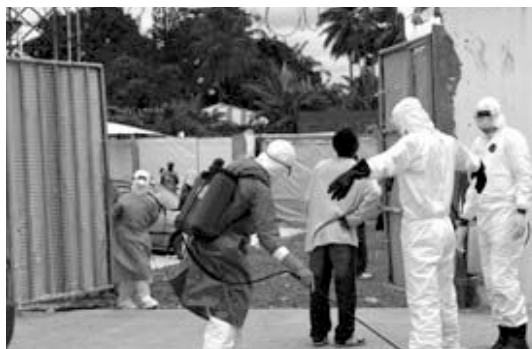
El virus del ébola continúa imparable en Guinea, Liberia y Sierra Leona.

► Excetur Por su parte, Excetur se sumó a la línea de las declaraciones del Ministro de Industria, José Manuel Soria, al afirmar que "no son, pues, momentos para alarmismo y alentar especulaciones que pudieran afectar a la imagen de seguridad de España o a una demanda turística internacional hacia nuestro país que no se ha visto afectada". Excetur también pidió que las administraciones redoblen sus esfuerzos para informar y actualizar de manera clara