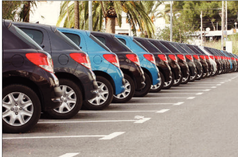
Vehículos de alquiler almacenados en un solar de una empresa de Palma.

Así, recuerdan en el mismo comunicado diferentes medidas como la «indeseada» subida del IVA en 2012, la «arbitraria imposición» en 2013 de nuevos aumentos en las tasas aeroportuarias, la implantación de tasas tu-