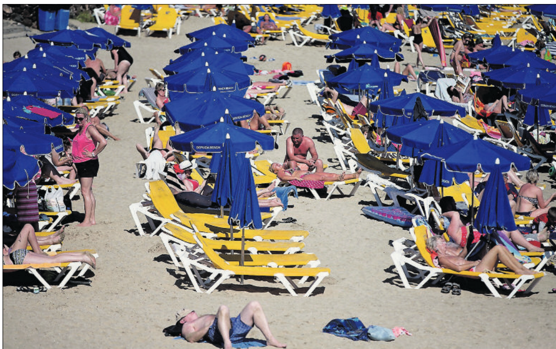
Lanzarote es una de las islas más beneficiadas por la afluencia extranjera. En la foto, aspecto de Playa Blanca en abril.