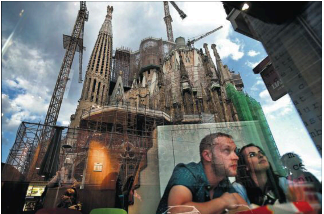
Barcelona es la única ciudad española con una imagen de marca internacional.

Para salvar al turismo urbano de la crisis (en 2012 sus ingresos cedieron un 4,6%), los expertos tienen claras las recetas. Da igual que sean empresarios o alcaldes. La salida pasa por vender las urbes españolas como destinos y experiencias turísticas en el exterior, sobre todo en los países emergentes, ("por lejos que estén", según el regidor malagueño Francisco de la Torre), que son los que crecen económicamente. Sin embargo, las ciudades españolas se encuentran muy lejos de figurar en el top de preferencias de los turistas europeos (los mayores clientes de España), según Federico González Tejera, consejero delegado de NH Hoteles, la pri-