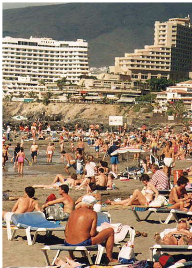
Los precios subieron un 14% en Adeje y un 11% en Arona el año pasado.

En cualquier caso, el último HPI señala que el pasado año, cuando se registraron grandes incrementos de forma generalizada en España, Ibiza fue donde más aumentaron los precios, un 29%