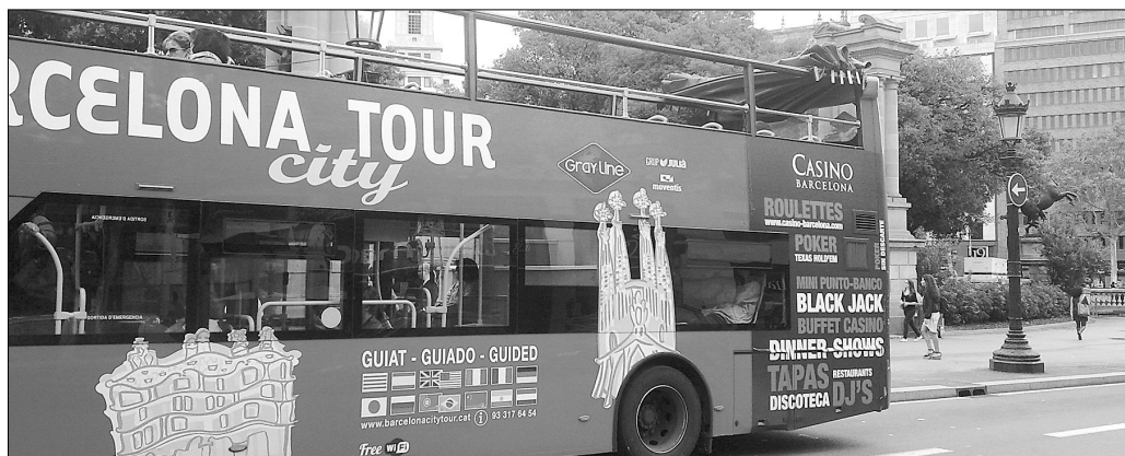
El PIB turístico vuelve a caer en 2012 un 1,6%, según las estimaciones de Exceltur.

Uno de los bastiones que se ha sobrepuesto a la crisis empieza a mostrar alguna que otra brecha. Sin embargo, los políticos están muy atareados en recortar el déficit y no en poner solución a los puntos flacos de un sector en el que seguimos siendo una potencia mundial. El turismo se