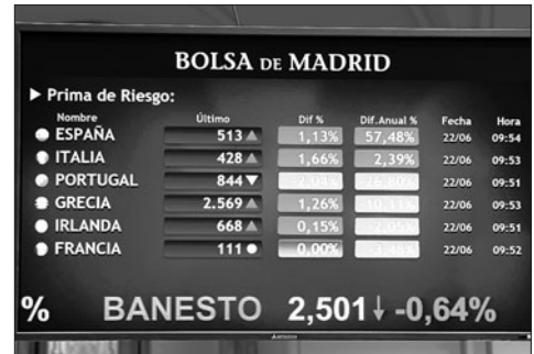
La prima subió por un momento a 513 puntos.

en los hoteles españoles, que reflejan un avance de sólo el 0,4% interanual. El resultado sugiere que, aunque vienen más extranjeros, su estancia es más corta.