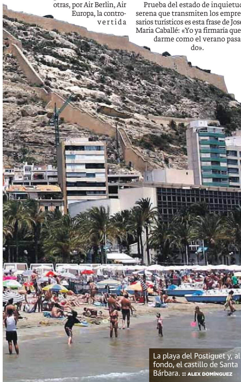
La playa del Postiguet y, al fondo, el castillo de Santa Bárbara.