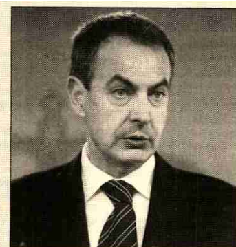
Jose Luis Rodríguez Zapatero

El Ejecutivo también ha dado luz verde a un Plan de Turismo Cultural que promocioe los productos culturales en el exterior, sobre todo en el continente europeo, a través de las Oficinas Españolas de Turismo, así como al estudio de medidas que fomenten el desarrollo, en la próxima década, de turismo sostenible del medio rural.