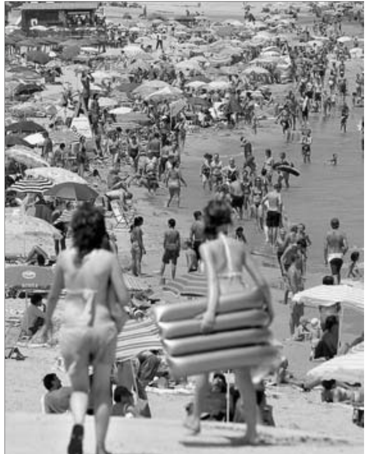
Los españoles han optado este año por las playas nacionales.

Para que España recupere el ritmo, Zoreda apunta a un necesario cambio de rumbo que mejore el sector de cara al final de la crisis. Para ello, Exceltur ha pedido al presidente del Gobierno «su firme compromiso de liderazgo en favor del turismo como factor clave de futuro y motor de recuperación económica».