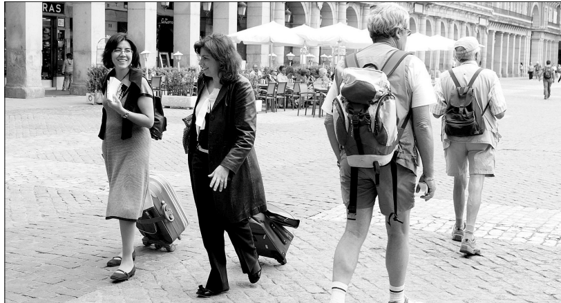
El aumento del turismo nacional será del 11% en el conjunto del año.

La primera industria nacional no va sólo a por el récord de visitantes extranjeros según estima el ministro, José Manuel Soria, sino que la parte que representa el viajero nacional, se empieza a despertar y, esto, se constata en los indicadores porque crece a ritmos de entre el 11% y el 16%. Y no sólo por la evolución de la ocupación de los establecimientos, sino porque tras varios ejercicios con el agua al cuello, el sector turístico empieza a elevar ligeramente sus precios, entre el 2% y el 3% y, sobre todo, recurre menos a las ofertas, de las que se ha alimentado en los últimos tiempos.