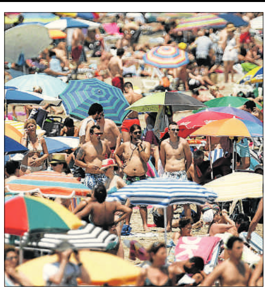
Imagen de la playa de la Malvarrosa, en Valencia, el sábado