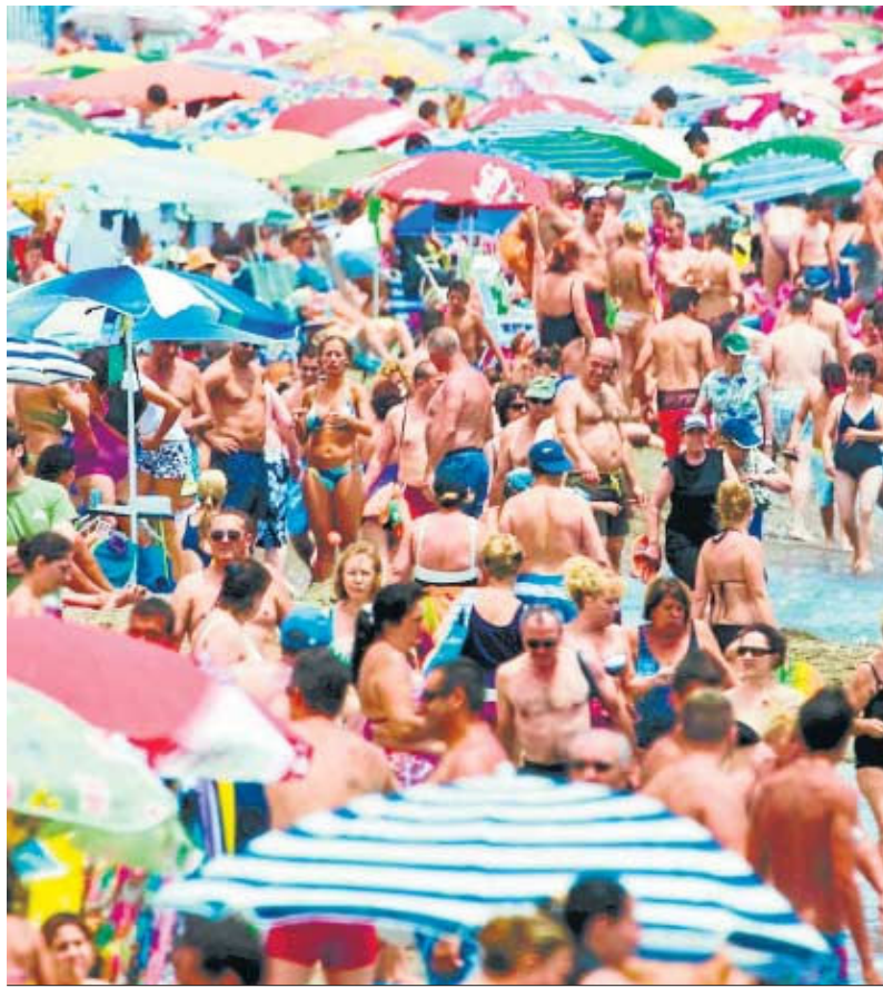
Cientos de personas disfrutan del buen tiempo en la malagueña playa de La Misericordia.

Calcular el impacto de esta decisión monclovita es complicado. Exceltur, alias alianza para la excelencia turística, teme que el sector turístico patrio deje de ingresar 2.000 millones al año y pierda 18.730 empleos directos. La Confederación de Agencias de Viajes (CEAV) niega no obstante castigo alguno a su nicho empresarial. Paradores Nacionales advierte de un alza de entre 2 y 4 euros por habitación. En Andalucía, la Junta utiliza las cifras de Exceltur para ofrecer su propio cálculo. "El PIB turístico podría caer un 1% en 2012 y afectar a entre 2.000 y