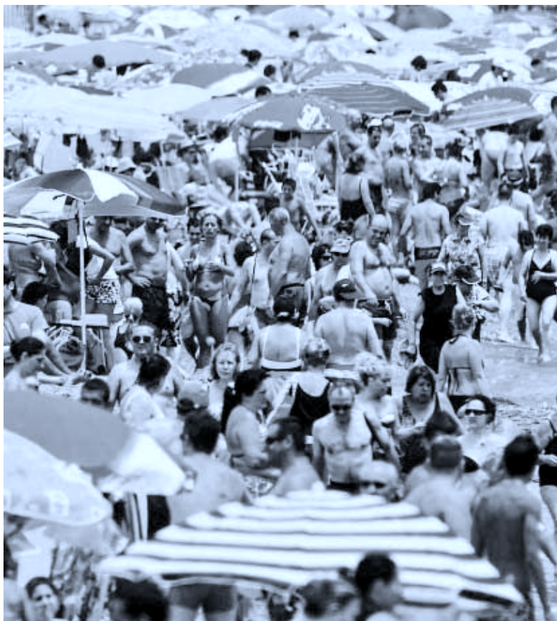
Cientos de personas disfrutan del buen tiempo en la malagueña playa de La Misericordia.

Calcular el impacto de esta decisión monoclovia es complicado. Exceltur, alias alianza para la excelencia turística, teme que el sector turístico patrio deje de ingresar 2.000 millones al año y pierda 18.730 empleos directos. La Confederación de Agencias de Viajes (CEAV) niega no obstante castigo alguno a su nicho empresarial. Paradores Nacionales advierte de un alza de entre 2 y 4 euros por habitación. En Andalucía, la Junta utiliza las cifras de Exceltur para ofrecer su propio cálculo. "El PIB turístico podría caer un 1% en 2012 y afectar a entre 2.000 y