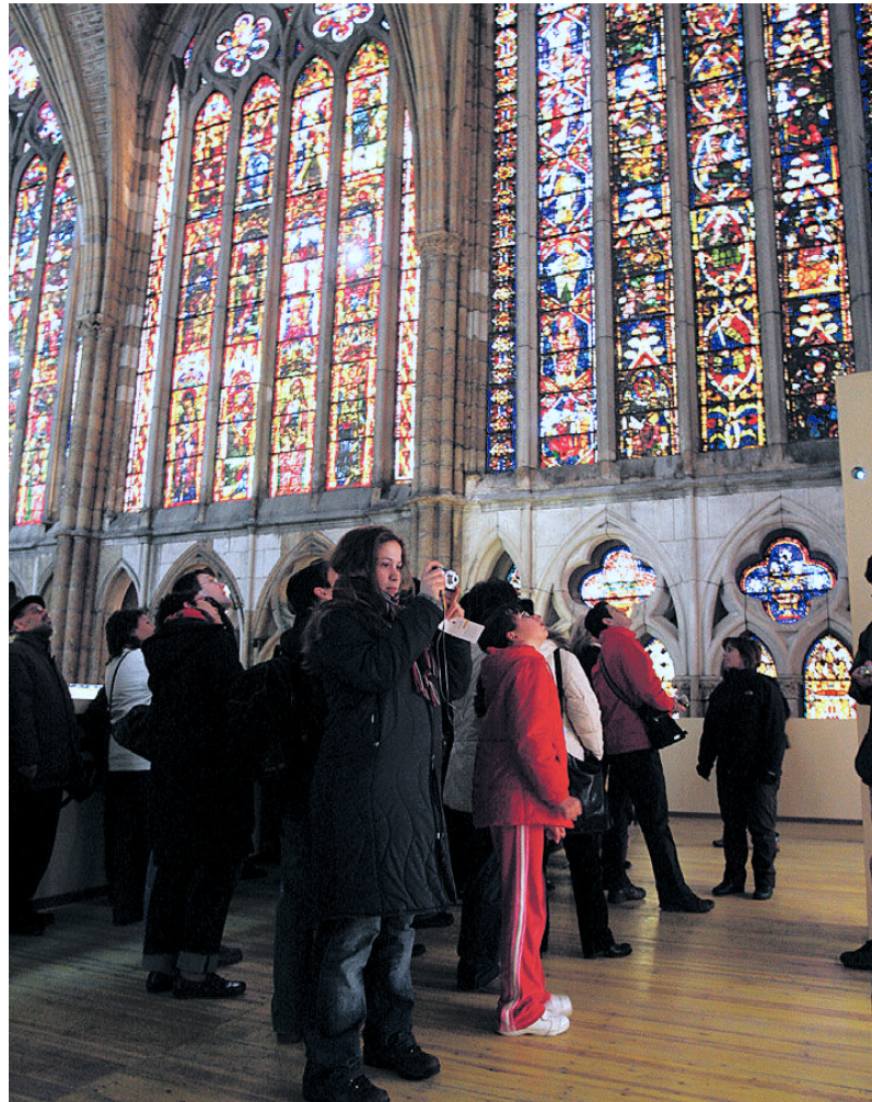
Varios turistas admirando las vidrieras de la Catedral de León.

Por otra parte, la recuperación que se vivió hace un año en el turismo a nivel nacional no se dejó notar en León, y sí en el destino de