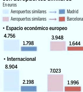
(*) Avión tipo: B 737-400 ocupación 115 pasajeros Infografía LA RAZÓN

millones de turistas (entre españoles y extranjeros), lo que implica no ingresar 1.636 millones.