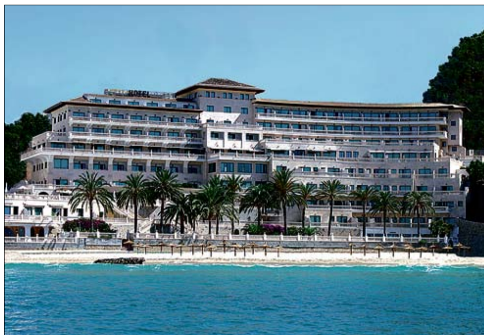
Los hoteleros rechazan el incremento del IVA.

Por ello, el sector rechaza la subida del IVA y pide que su implantación sea "como muy pronto a principios de octubre", cuando haya pasado el grueso de la temporada, aunque asegura que lo más lógico sería esperar