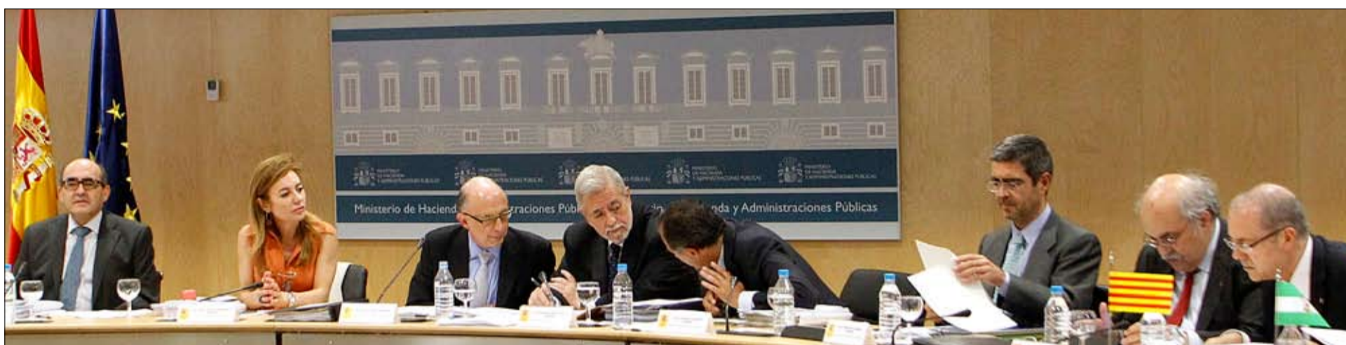
Montoro y los secretarios de Estado del Ministerio de Hacienda amonestaron ayer a ocho comunidades.

La Gaceta. Viernes, 13 de julio de 2012. Número 7.232