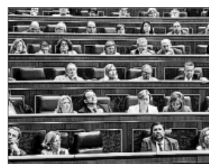
Imagen del Congreso durante las votaciones de ayer.

pymes a las que debe dinero la Administración –se dispondrá de una línea de crédito oficial con hasta 3.400 millones de euros para que los ayuntamientos paguen sus deudas.