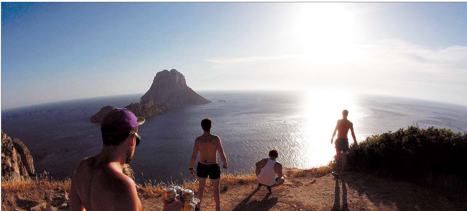
Los turistas se reúnen para ver la puesta de sol en los acantilados de Es Vedra, en la isla española de Ibiza.