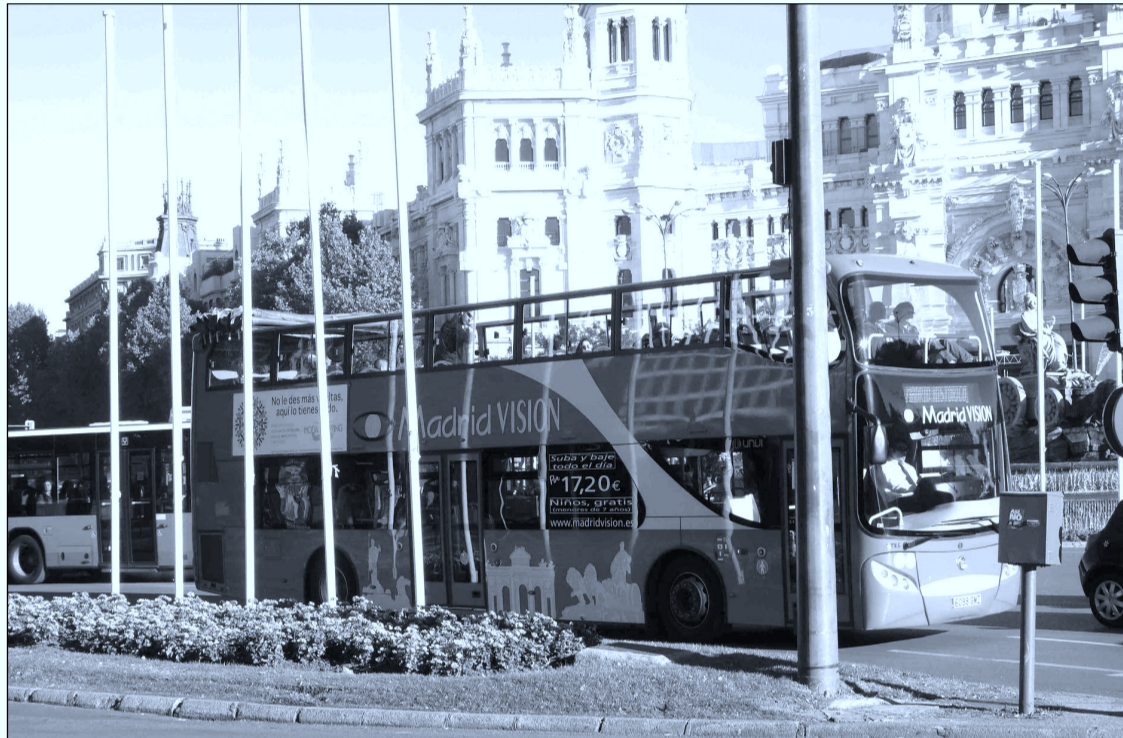
Las estimaciones que maneja el Ejecutivo para esta temporada de verano hablan de repunte de entre el 10% y el 15%.

Las estimaciones que maneja el Ejecutivo para esta temporada de verano hablan de repunte de entre el