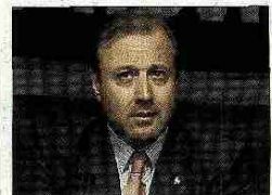
El secretario de Estado Joan Mesquida.