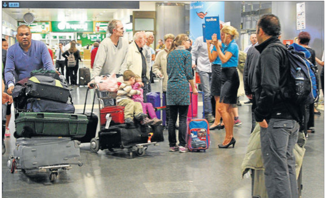
Lleno absoluto. Turistas a su llegada al aeropuerto de Gran Canaria.

De estos, 2.030.537 correspondieron a tráfico internacional, un 12,8% más que en diciembre de 2012, lo que confirma que también se incrementaron los movimientos nacionales, aun-