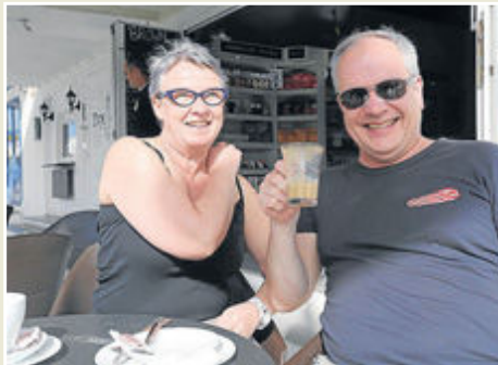
Tranquilidad. Los Turunen no piensan hacer esfuerzos.