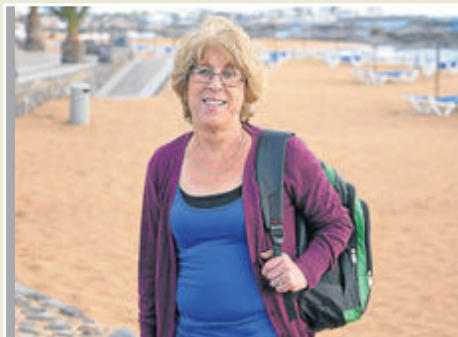
Desde Toulouse. A Rosario le sorprende el desierto majorero.