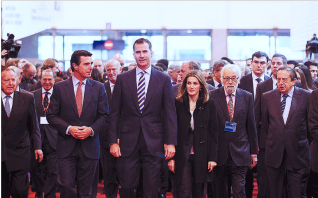
Los Príncipes de Asturias y el ministro de Industria, Energía y Turismo, José Manuel Soria López, entre otras autoridades, inauguran Fitur 2012.