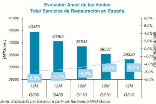
Gráfico 4: Ventas de servicios de restauración

Pero si mal les ha ido a los dueños de los hoteles, no les va mejor a los de establecimientos de restauración, que han visto un 2010 peor, incluso, que 2009. Así, los restaurantes han perdido un 3,4% de las ventas , mientras que los bares y cafeterías caían un 1,5%.