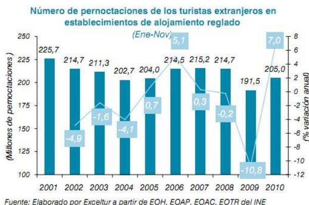
Gráfico 2: Pernoctaciones turistas extranjeros

También ha bajado el gasto medio por turista extranjero (medido en precios constantes de 2010) de los 1.017 euros de 2000 a los 742 de una década después; aunque como noticia positiva habría que destacar que en 2010 se ha revertido la tendencia descendente por primera vez en toda la década. Es decir, que nos visitan menos turistas y los que vienen son más rácacos .