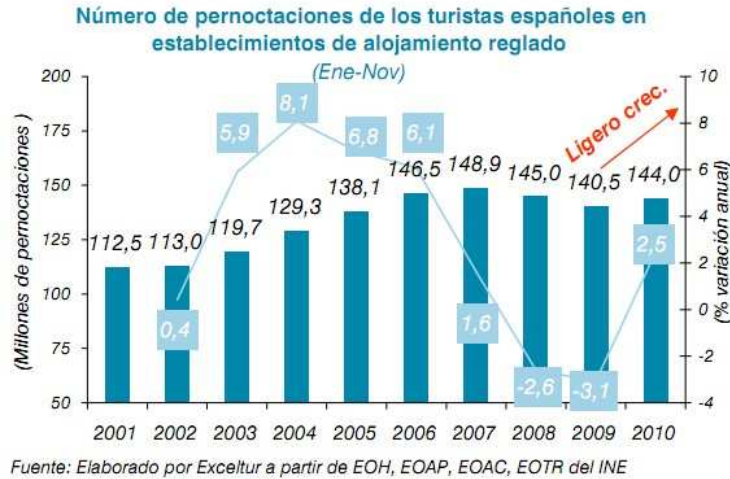
Gráfico 3: Pernoctaciones de turistas españoles