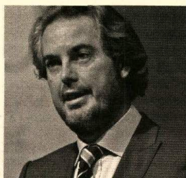
SEBASTIÁN ESCARRER PRESIDENTE DE EXCELTUR

Joan Mesquida, secretario de Estado de Turismo, indica que cabe albergar un «moderado optimismo» de cara a 2010, tras «un año 2009 complicado». Se muestra además confiado en cuanto al aumento en la llegada de turistas extranjeros a lo largo de este año, «ante las mejores expectativas económicas de los principales mercados emisores». Mesquida sigue apostando por el turismo como motor de crecimiento económico para los próximos años.