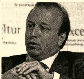
JOAN MESQUIDA SECRETARIO ESTADO DE TURISMO

Joan Mesquida, secretario de Estado de Turismo, indica que cabe albergar un «moderado optimismo» de cara a 2010, tras «un año 2009 complicado». Se muestra además confiado en cuanto al aumento en la llegada de turistas extranjeros a lo largo de este año, «ante las mejores expectativas económicas de los principales mercados emisores». Mesquida sigue apostando por el turismo como motor de crecimiento económico para los próximos años.