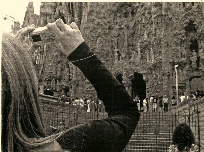
FUTURO INCIERTO. El turismo no caerá en España hasta los niveles de 2009 pero seguirá registrando una tasa negativa en 2010

MEJOR ENTRADA DE TURISTAS. Si bien es cierto que 2009 ha sido un año nefasto para el turismo a nivel internacional, con una caída del