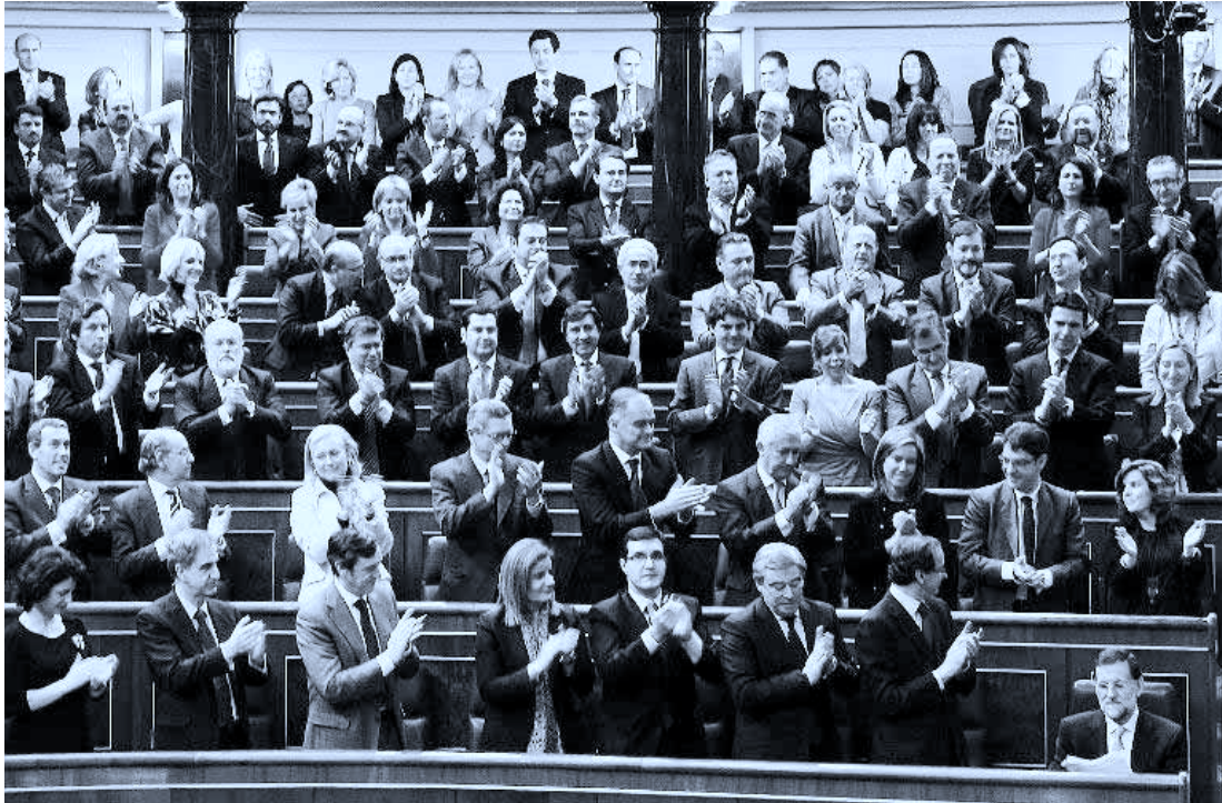
Los diputados del Partido Popular aplauden a su líder, Mariano Rajoy, tras su discurso.