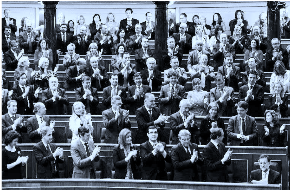
Los diputados del Partido Popular aplauden a su líder, Mariano Rajoy, tras su discurso.