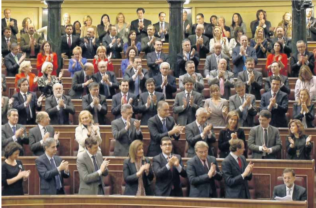
Los diputados del Partido Popular aplauden a su líder, Mariano Rajoy, tras su discurso.