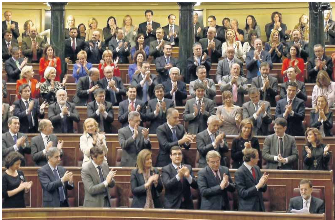
Los diputados del Partido Popular aplauden a su líder, Mariano Rajoy, tras su discurso.