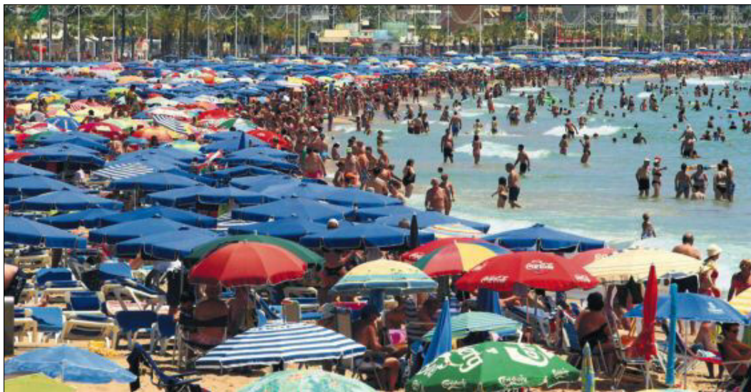
La playa de Levante en Benidorm, Alicante, abarrotada de turistas.

Estalella reconoce que la incertidumbre de Egipto y Turquía han colaborado al repunte de las costas españolas. El lobby turístico Exceltur calcula que se han desviado hacia España unos 720.000 turistas, un empujón para rebasar las cifras de 2012. Los precios de los hoteles, asegura, siguen ajustados y los operadores turísticos han mantenido el coste de sus paquetes vacacionales.