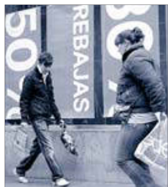
Escaparate de una tienda en rebajas.

► El Corte Inglés. Los grandes almacenes han lanzado una nueva Semana de Oro -prorro-