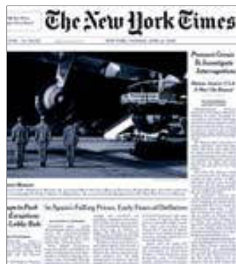
La crisis española, en portada.

► Deflación. En un artículo titulado La caída de los precios en España alimenta el miedo a la deflación en Europa , el diario explica que nuestro país ha sido el primero de la zona euro en presentar una tasa negativa de inflación, y que pese a que ésta es de sólo el 0,1%, es la primera que se registra en España desde 1961. Y ello implica que el resto de países ten-