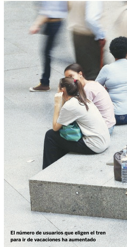
El número de usuarios que eligen el tren para ir de vacaciones ha aumentado

empresas del sector esperan esta subida gracias al incremento en el consumo de los nacionales. Eso sí, uno de los cambios que se aprecia este año, al contrario que los años de crisis previos, es que en esta ocasión los viajes más demandados son fuera de nuestras fronteras. Dentro de España, los destinos favoritos son las zonas costeras y algunas áreas del interior peninsular como Madrid donde, de acuerdo con la venta de billetes que han hecho los socios