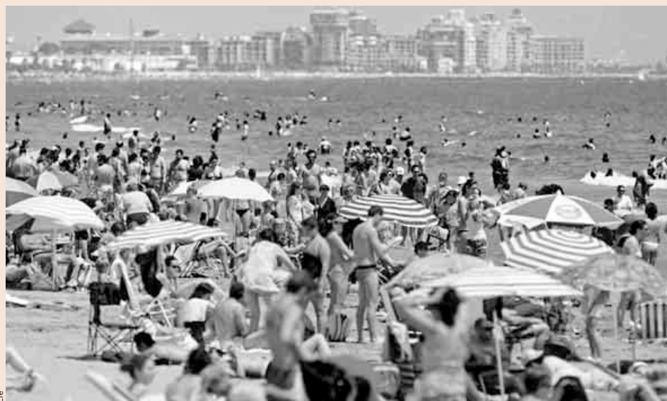
La playa de la Malvarrosa, en Valencia.

Con todo, desde Exceltur reconocen que una parte de la buena situación actual se debe a los problemas de Egipto, que son coyunturales. Las revueltas han provocado que buena parte de los turistas