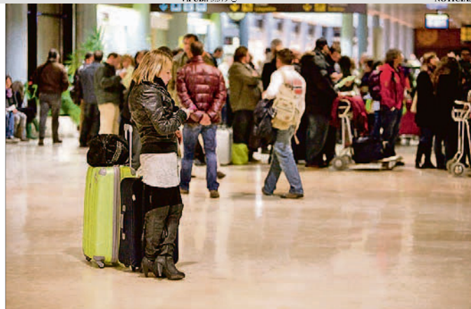
Viajeros en el aeropuerto de Asturias.

Oviedo, M. J. I. Entre los viajeros que escogen Asturias como destino de Semana Santa predominan los españoles y por comunidades de origen destaca la Comunidad de Madrid, seguida de País Vasco, Galicia y Castilla y León, igual que en temporadas pasadas. La cuota de mercado del turismo internacional en el Principado sigue entre las más bajas de España, una tendencia que los empresarios confían en cambiar en los próximos años. El sector turístico también respira aliviado ante unas previsiones meteorológicas que alejan la lluvia de la región, al menos hasta el próximo viernes.