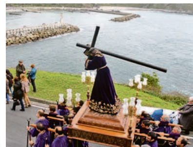
Procesión del Nazareno, en Luarca.