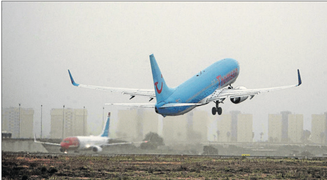
Un avión despegando del aeropuerto de Alicante en una imagen tomada este mismo invierno.