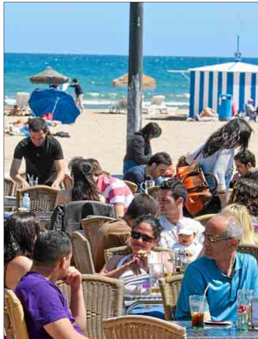
Turistas y vecinos de Valencia, ayer, en una terraza en la Malvarrosa.

Por zonas, el litoral de Castellón salió el mejor parado con una ocupación del 77%, un 1,32% más que hace un año. El litoral de la costa alicantina —sin incluir Benidorm— repitió el 70% de ocupación de 2011. La capital de la Costa Blanca rozó el 90%, con un sensible retroceso del 3%. El de la provincia de