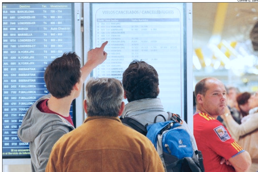
Varios afectados por la huelga consultan los vuelos cancelados

Es posible que los pilotos sean conscientes de que sus paros pueden tener un efecto desastroso sobre el turismo pero, por el momento, no están dispuestos a ceder en sus reivindicaciones.