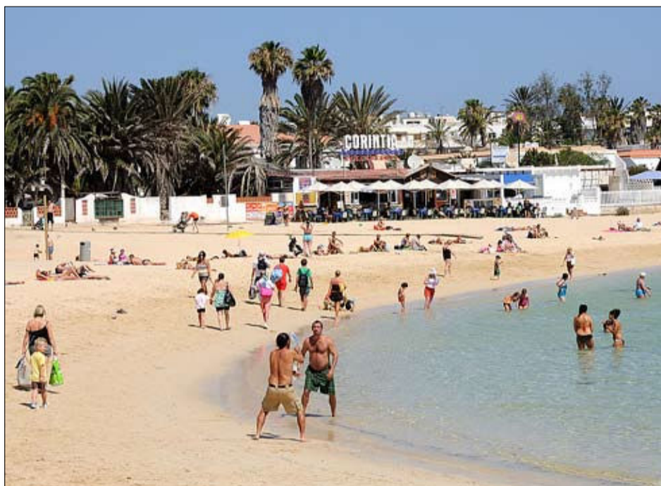
Canarias se ha beneficiado casi en exclusiva de este repunte.

Zoreda espera que la mejora se extienda a todos los destinos, ya que en el primer trimestre Canarias