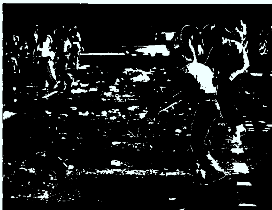
A PUNTO. En Sevilla también amplían los servicios de limpieza.

cialmente significativa en los lugares donde se producen mayores aglomeraciones.