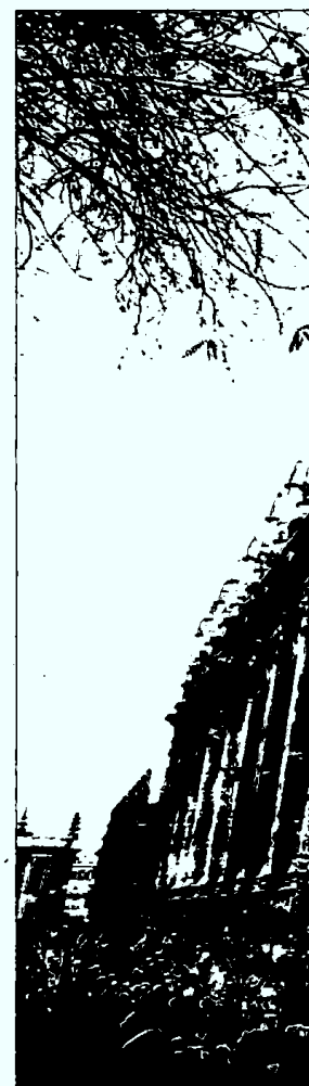
DEVOCIÓN. La Esperanza de Triana

¿TREN O BUS? El dato arrojado por la DGT es significativo pero no determinante: otros medios de transporte también terrestres como los trenes o los autobuses han ampliado sus plazas ante las buenas previsiones turísticas de la semana. Renfe, por ejemplo, re-