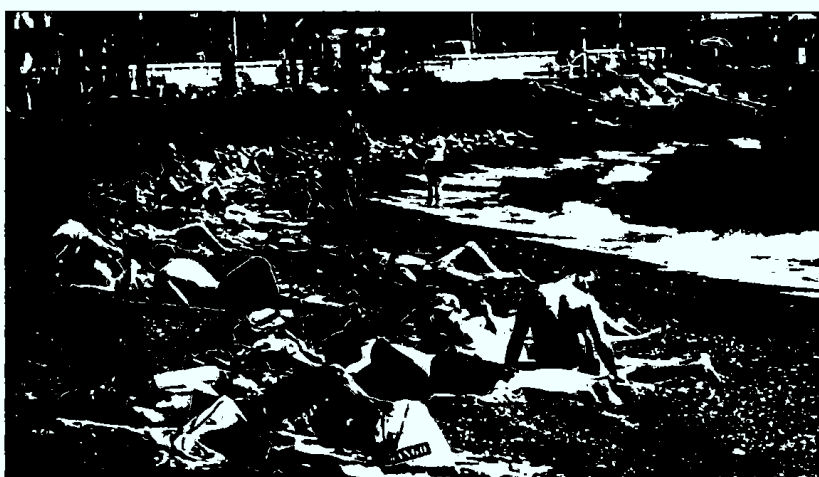
CALOR. La playa de Málaga es uno de los destinos preferentes para los turistas en estas fechas.

Pese a que en las ocho provincias de Andalucía se ha organizado un plan de limpieza y de revisión especial, la seguridad no pasa por ello a un segundo plano. En Córdoba, por ejemplo, más de un centenar de efectivos de la Policía Local velarán por la seguridad y el tráfico durante la celebración de la Semana Santa, según informó el alcalde de la ciudad, Andrés Ocaña, tras la celebración de la Junta Local de Seguridad. Así, la presencia en la calle de los agentes será espe-