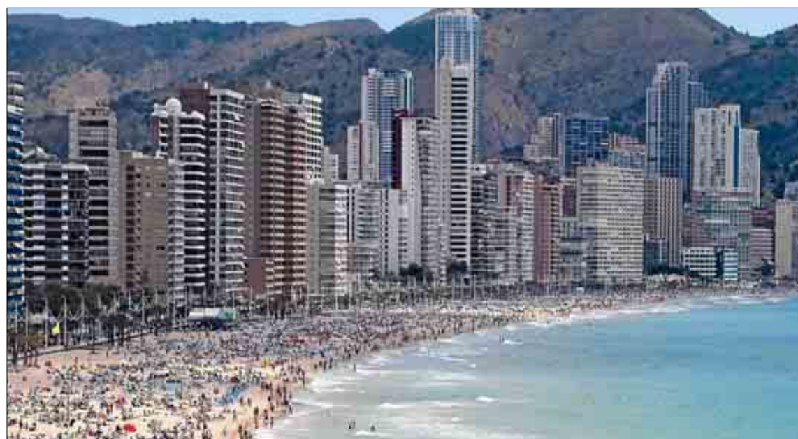
Aspecto que presentaba ayer la playa de Levante de Benidorm.

El hundimiento del segmento de cinco estrellas tanto en Alicante como en Valencia se presenta como un duro obstáculo para acercarse a la rentabilidad de otros territorios. Sin embargo, la particular recesión de la hotelería de lujo no impide que el sector se muestre moderadamente optimista en sus expectativas. Para Semana Santa y también para verano. De hecho, según una encuesta de Exceltur, seis de cada diez empresarios turísticos de la Comunidad prevén mejorar este verano sus ingresos con respecto al año pasado.