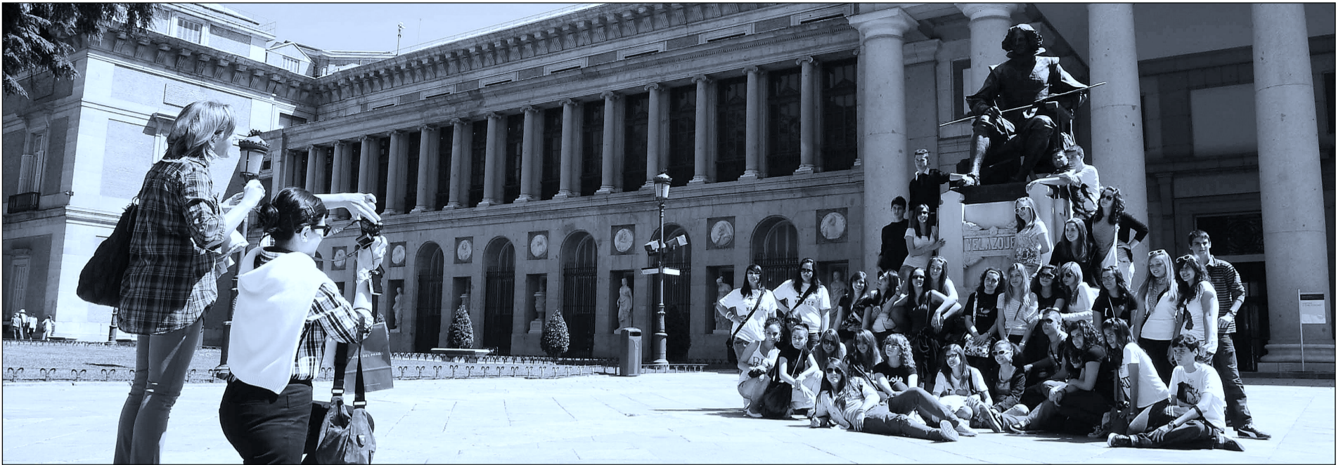
Los expertos insisten en que es necesario reinventar el modelo para seguir atrayendo visitantes.

Hace tiempo que no había tanta unanimidad sobre las expectativas del sector turístico. Los expertos ya eran optimistas a primeros de año, un optimismo que se ha acrecentado ante las estimaciones de 'pleno' en Semana Santa y de crecida de número de visitantes hasta el