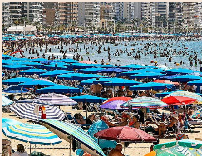
Benidorm (Alicante) es una de las localidades que registraron una buena temporada turística.

El buen año también responde a que las familias españolas todavía disponen de ahorro embalsado. De hecho, es el turismo nacional el que mejor y de forma más regular